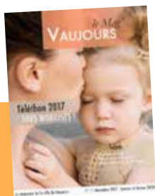
Vaujours le Mag' N° 51 trimestriel

Directeur de la publication: Dominique BAILLY Conception, rédaction et mise en page: Aurélie GROGNET avec la collaboration de Yeliz CESUR Imprimerie: Desbouis Grésil Tirage: 4000 exemplaires Régie publicitaire: CMP Magazine imprimé sur papier issu des forêts gérées durablement.