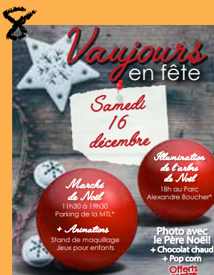
Décembre en fête (marché de Noël...)