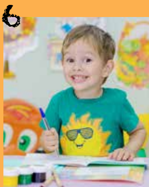
Point sur les inscriptions scolaires et le périscolaire

Directeur de la publication: Dominique BAILLY Conception, rédaction et mise en page: Aurélie GROGNET avec la collaboration de Yeliz CESUR Imprimerie: Desbouis Grésil Tirage: 4000 exemplaires Régie publicitaire: CMP Magazine imprimé sur papier issu des forêts gérées durablement.