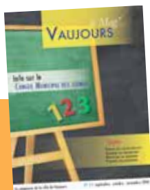
Vaujours le Mag' N° 55 trimestriel