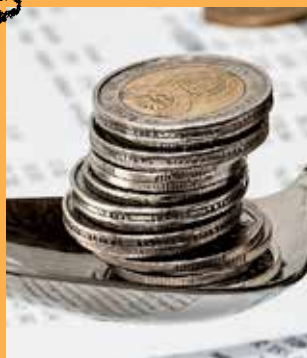
Finances publiques : le bilan est positif

Directeur de la publication : Dominique BAILLY Conception : Aurélie GROGNET Rédaction : Services municipaux Imprimerie : Desbouis Grésil Tirage : 4000 exemplaires Régie publicitaire : CMP Magazine imprimé sur papier issu des forêts gérées durablement.