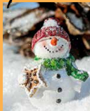
Le marché de Noël arrive bientôt...