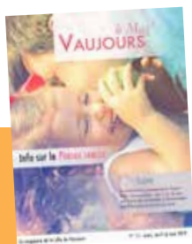
Vaujours le Mag' N° 56 trimestriel