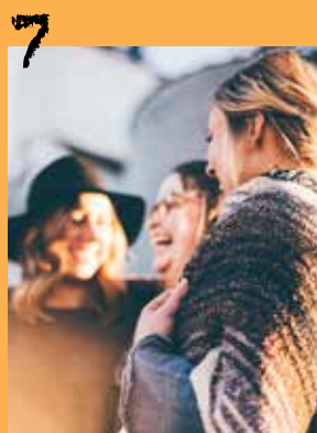
Repas de quartier