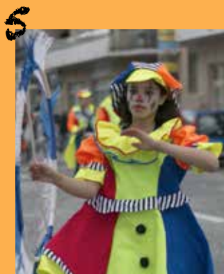
Vaujours en fête

Magazine imprimé sur papier issu des forêts gérées durablement.