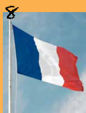
Se souvenir ensemble