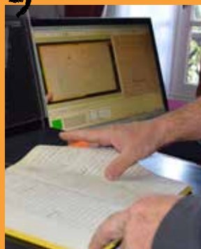
Numérisation des actes administratifs