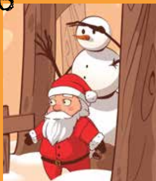
Décembre en fête