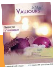
Vaujours le Mag' N° 59 trimestriel