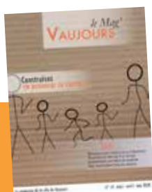
Vaujours le Mag' N° 60 trimestriel

Les élections municipales se tiendront les 15 et 22 mars 2020. En raison de la période électorale, et en application des règles juridiques concernant les supports d'informations municipaux, cette édition de Vaujours le Mag' ne comporte pas d'éditorial du Maire.