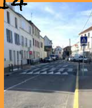
Travaux de sécurisation