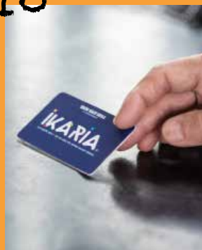
IKARIA, la carte des seniors.