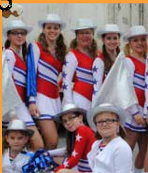
Vaujours en fête, les 9 et 10 mai.