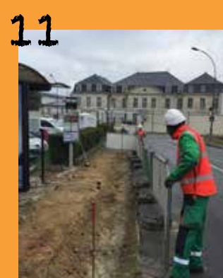
Mise en conformité des arrêts de bus