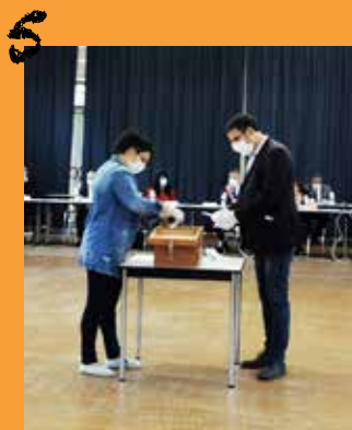
Installation du nouveau conseil municipal