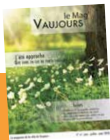
Vaujours le Mag' N° 61 trimestriel