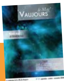
Vaujours le Mag' N° 62 trimestriel