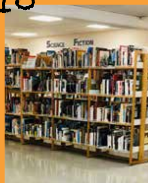
La bibliothèque s'est réorganisée