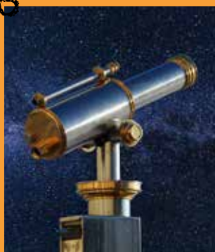
Week-end astronomique au parc de la Poudrerie