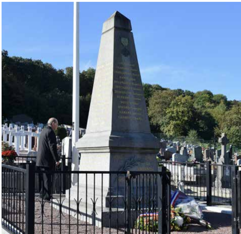
Cimetière de Vaujours

Le devoir de mémoire est l'obligation morale de se souvenir d'un événement historique tragique, en reconnaissant les souffrances de ceux qui en ont été victimes, afin de prévenir la reproduction des mêmes crimes. Ce concept, né après la Seconde Guerre mondiale, s'est élargi à d'autres épisodes tragiques de l'histoire. À l'époque, l'idée sous-jacente était que les rescapés avaient un impératif moral de mémoire. Aujourd'hui, alors que les années passent, il est important de se souvenir que d'autres générations ont vécu la guerre et ses atrocités. Il est de notre responsabilité que ce devoir lui-même ne tombe pas dans l'oubli. Participer aux commémorations est l'occasion de le faire de façon solennelle, en présence de personnes engagées et d'anciens combattants. Que la jeunesse honore ce devoir est un bel hommage à nos aînés.