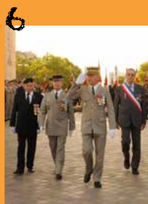
Devoir de mémoire