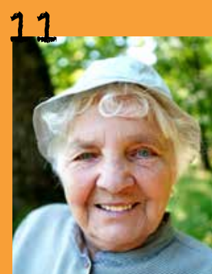
Appel à candidature du Conseil des Sages