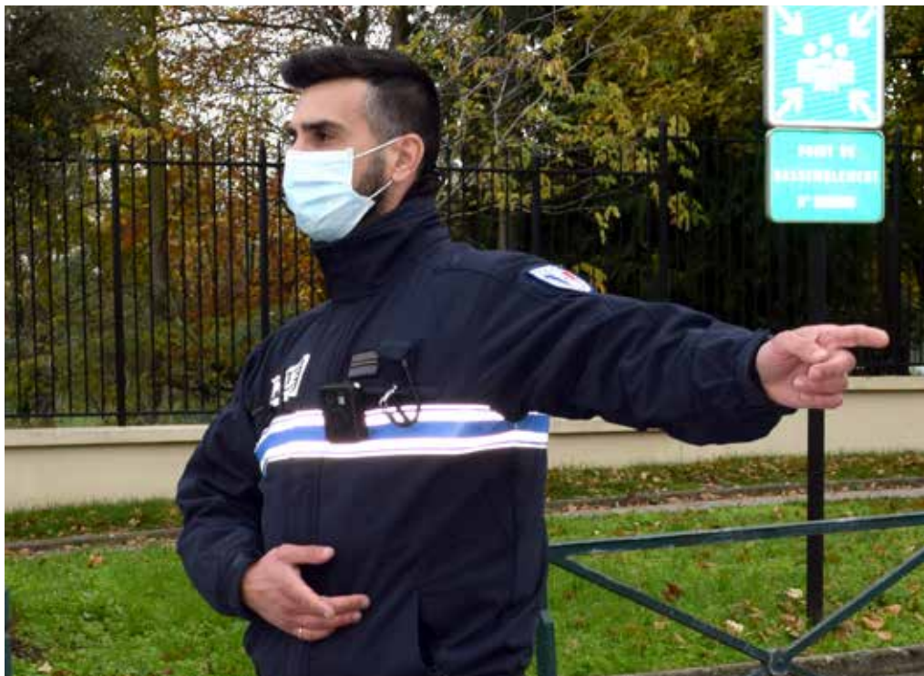
Photo d'un agent de police intercommunale de Vaujours et Coubron, muni d'une caméra portée

Dorénavant chaque patrouille est dotée d'une caméra-piéton permettant un meilleur service à la population et une meilleure protection des agents. La police intercommunale réalise une centaine d'interpellations en flagrant délit annuellement. Elle intervient également quotidiennement pour des résolutions de conflits de voisinages, d'automobilistes ou des nuisances sonores. Bien qu'aucune interpellation n'ait jamais fait l'objet de contestation, les villes de Vaujours et Coubron ont choisi d'équiper leur police intercommunale de cet outil technologique. En effet, les retours d'expérimentation sont très positifs. Par leur simple présence, les caméras-piétons désamorçeraient les situations conflictuelles et responsabiliseraient les différents acteurs. C'est dans la boîte !