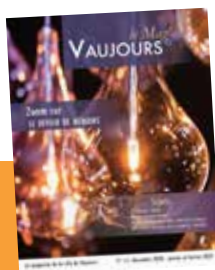
Vaujours le Mag' N° 63 trimestriel