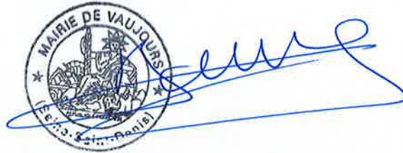
Dominique BAILLY Vice-président de Grand Paris – Grand Est